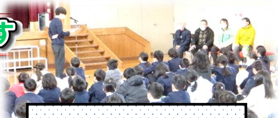
昨年のスクールガードさんありがとう集会