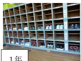
低学年も上手に入れています！