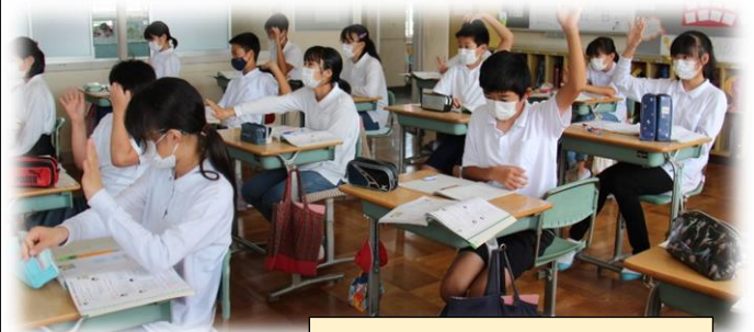
6年「比を使って考えよう」