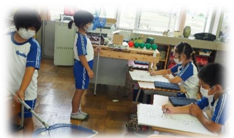
4年「人物のクロッキー」